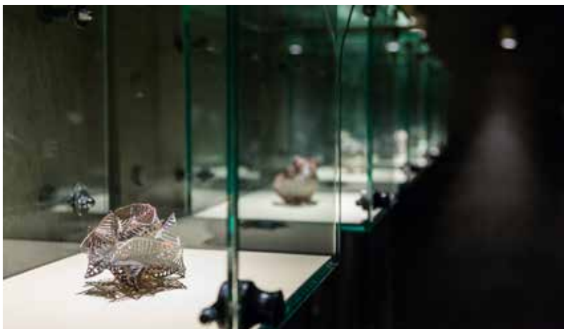
ARON LI

De lyriske kvalitetene gikk også igjen i Aron-Irving Li sine tynne og skjøre metallobjekter. Verkene synliggjorde håndens kontakt med materialet fra skapelsesprosessen, knyttet objektet til kroppen samtidig som formene ga assosiasjoner til menneskets påvirkning av miljøet, og sårbarheten så vel som kreftene som ligger i naturen.