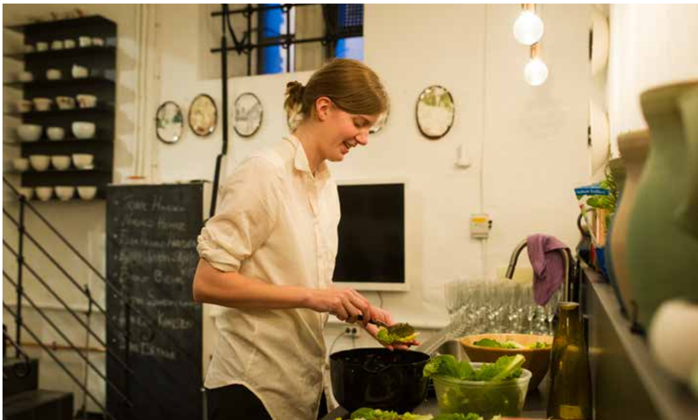
MATLAGNING i Krypten under Kuratorseminaret.