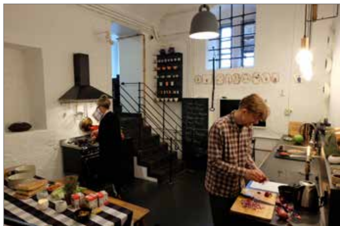
Matlaging i Krypten til I SHOULD HAVE KNOWN BETTER PART I.

ført de ulike gruppene av fagmiljøet nærmere hverandre.