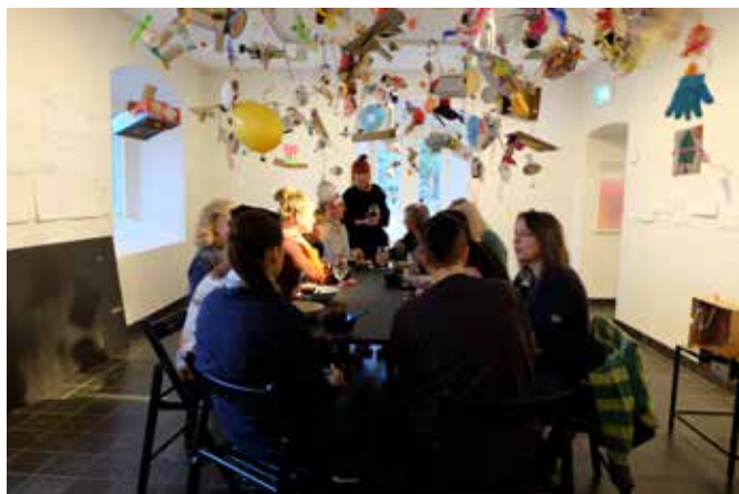
Utstillingen HIMMELFARERE fra Regien Coxs workshop med småskolen. Her bespisning i Prosjektrummet i forbindelse med foredragskveld.

Vi kan skryte av å ha gjennomført 14 utstillinger/presentasjoner med inviterte kunstnere i tillegg til to perioder med Pop Up-butikk i 2015. Det ble foretatt 5 innkjøp til offentlige samlinger i samme periode. Endringen av driftsprofilen har vært en stor suksess og responsen fra publikum og fagmiljø har vært svært positiv. Det at de forskjellige rommene har fått nye funksjoner har også