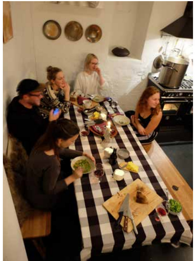
TASC ABLETT & BRAFIELD: relay.community.kitchen i Krypten.

Som vist i det ovenstående har KRAFT Bergen greid å opprettholde det høye aktivitetsnivået også i 2015. Dette er i seg selv ganske ambisiøst ettersom vi fortsatt kun har en 150% stillingsbrøk på fast basis til rådighet. Vi følger med andre ord opp Bergen Kommunes overordnede mål som nevnt i Bergen Kommunes strategiske handlingsplan for 2011-2015 der det blant annet står at Bergens status og synlighet som kunst- og kulturby skal ytterligere forsterkes. Med høyt faglig nivå som både er mangfoldig, originalt og modig, mener vi at KRAFT også lever opp til Bergen Kommunes hovedmål for Kunstbyen Bergen 2008-2017.