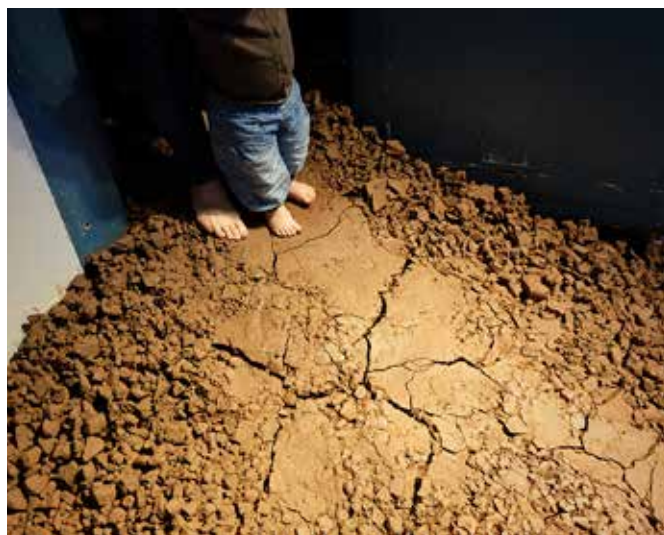
Kvernslåttens Barnehage på besøk i utstillingsrommet DEPOSIT.