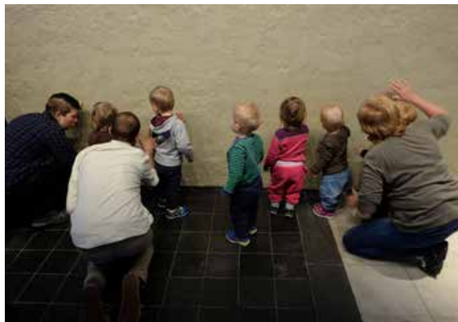
Kvernslåttens Barnehage på besøk i utstillingsrommet DEPOSIT.

Besøk av Kvernslåttens barnehage. Seks barn på 18 mnd. kom sammen med tre voksne for å oppleve utstillingen DEPOSIT. Barna fikk anledning til å klemme på den fuktige leireveggen og gå barføtt inn på leiren i Hvelvet. Etterpå vanket det fotbad og knaing av leireklumper. Kunstnerne var til stede.